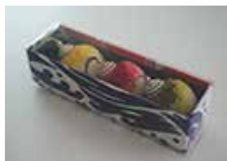
『POWDER STYLE』 2015.08.03