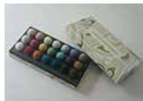
ボンボンカラースケール 春のレッスン教材 「ボンボンギルランド」

ウェブレッスンや特別講座でタッセルづくり りが学べるよう、オリジナルの教材や道具 を揃えました。