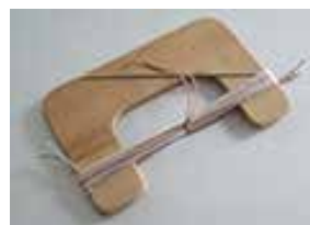
タッセル・スプール 秋の特別講座教材 「タッセル装飾とカーデントリミング」