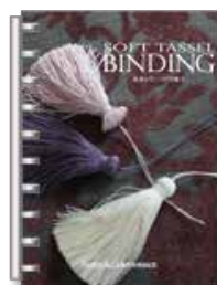
『SOFT TASSEL BINDING』 2015.12.05