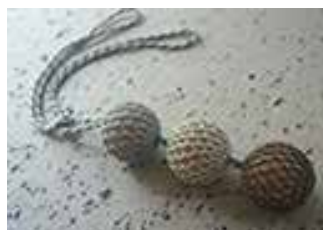
『TASSEL PORTO』 2015.06.28