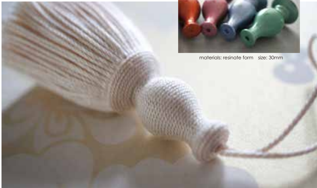
materials: supima cotton tassel size: 75mm