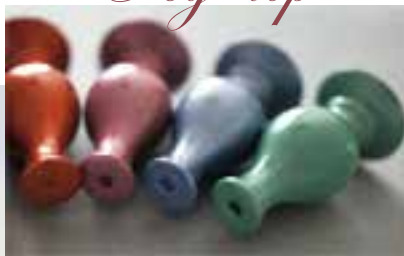
materials: resinate form size: 30mm