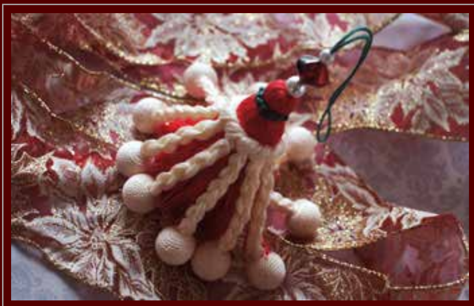
2014 ANNIVERSARY TASSEL