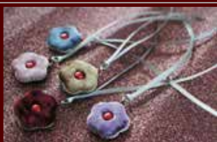
プチメイド「木花のオーナメント」

小さくてラグジュアリーなカルトナーージュ。 小花を象ったカメラ型 の オーナメント・ギフトタグです。 (2014年12月発表)