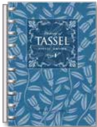
タッセル学 「房飾りの歴史」

なぜ？という問に対する探求心から、文献や資料をひもといて発見したタッセルのルーツやカルトナーージュのエピソードを新たに書き加えた本です。