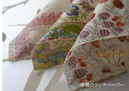
各種のランチペーパー

カルトナーージュならぬ張り子の手法を持ちいた「はりこなあ〜じゅ」（独自呼称）を考案し、カルトナーージュの新たな楽しみ方として発表しました。