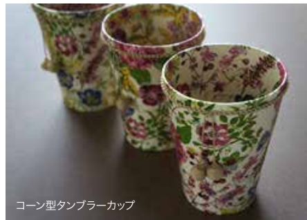
コーン型タンブラーカップ