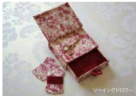
ソーイングドロワー