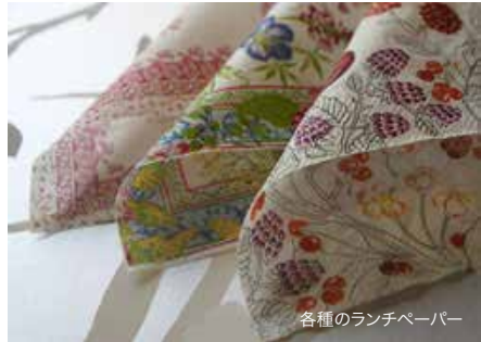
各種のランチペーパー

カルトナーージュならぬ張り子の手法を持ちいた「はりこなあ〜じゅ」（独自呼称）を考案し、カルトナーージュの新たな楽しみ方として発表しました。