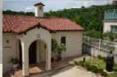
会場：上田安子記念館（西宮市）