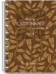
カルトナーージュ 「布箱に秘めた感性」